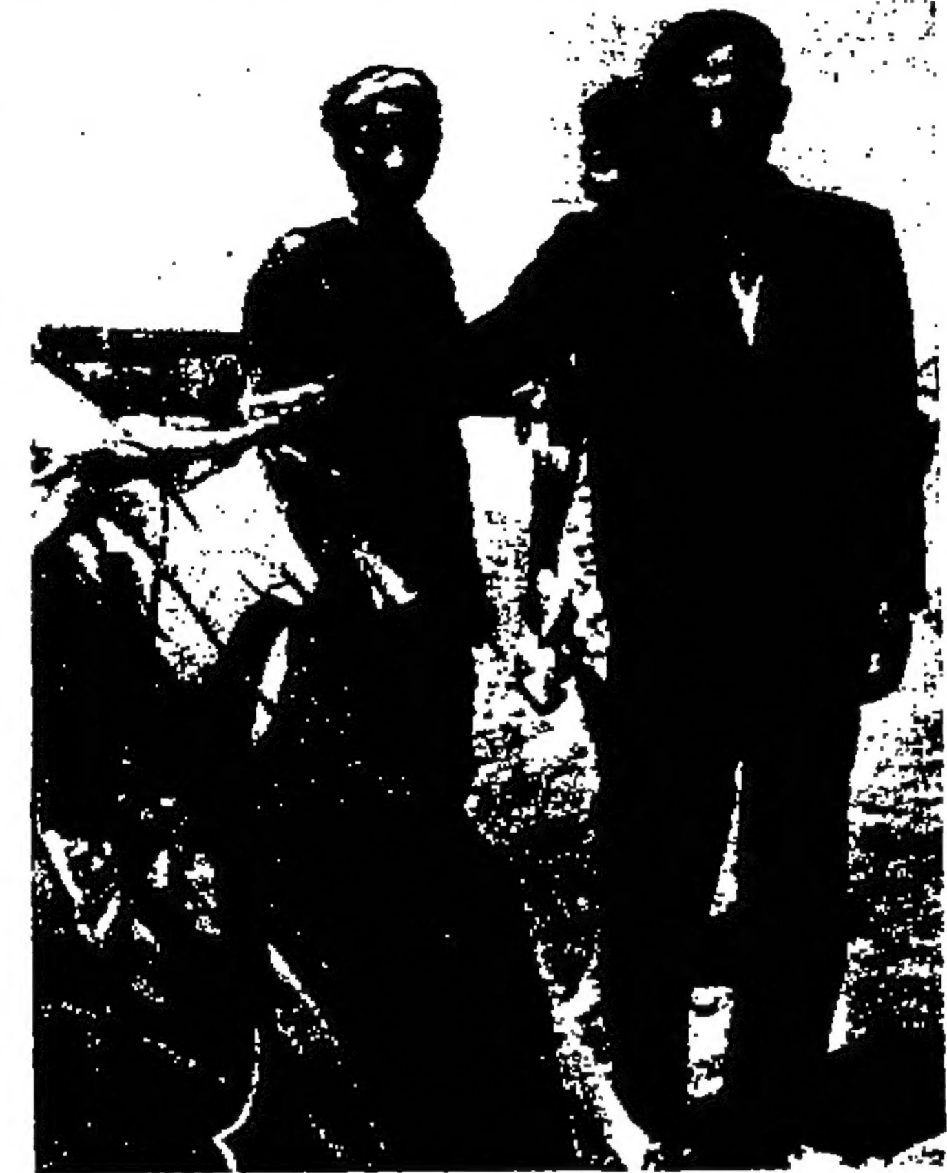
القزح العائد من لندن امام خيمته بملابس بريطانية تماماً لاجراء تحقيق صحفي عن القزحيين .

الشخصيات البارزة مثلين لثلاثين ومهما اظلمها والخيبان اللبانيين القان نصبتا بجلب كسمة سانت مارتن في ميدان الطرف الاخر في لندن - والسيد عليان ترح عبر ٣٠ ملياً من فضاء المغفل انتقل في اقتسلب العدوان الى مخيم القومية تسم